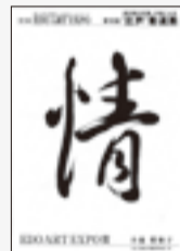
EDO ART EXPO賞