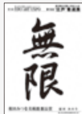
相田みつを美術館館長賞