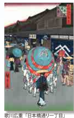
歌川広重「日本橋通り一丁目」

江戸っ子の美意識に「粹」があり、その反対は「野暮」といいます。 そして、一番「野暮な奴」とは、それは「粹がる奴」だといわれています。 ———「江戸っ子菓子屋のおつまみ噺」細田安兵衛著より