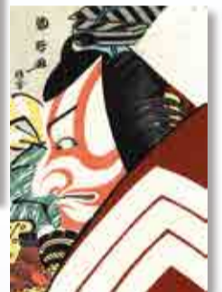
歌川国政「市川鯉蔵の暫」