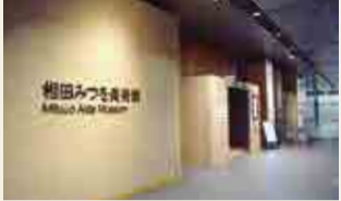
30 相田みつを美術館

第79回企画展 「日めくりの世界」 会期:9/30(金)~2023/1/29(日)