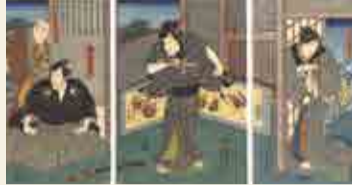
36 山田書店ギャラリー